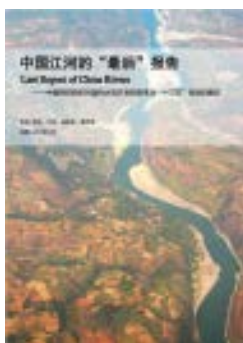
《中国江河的“最后”报告》