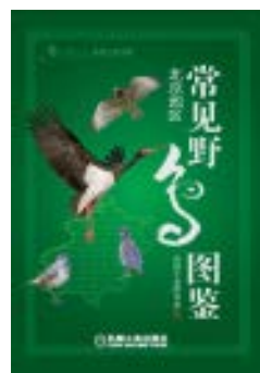
《常见野鸟图鉴·北京地区》