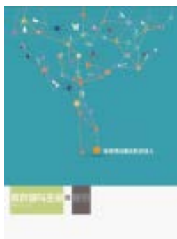
《废弃物与生命》教材