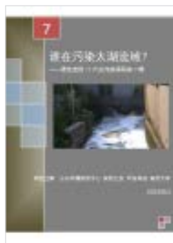
《谁在污染太湖流域?》