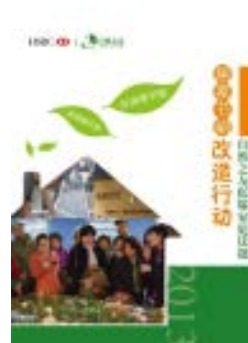
《居家节能改造行动》手册