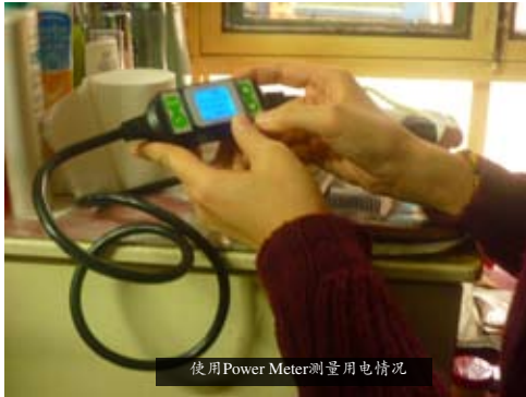
使用Power Meter测量用电情况

在北京市交道口街道的7个社区开展居民家庭用电情况调查，了解居民的能源使用习惯，家庭用水量、用电量、用气量，各种家电的能耗情况等；