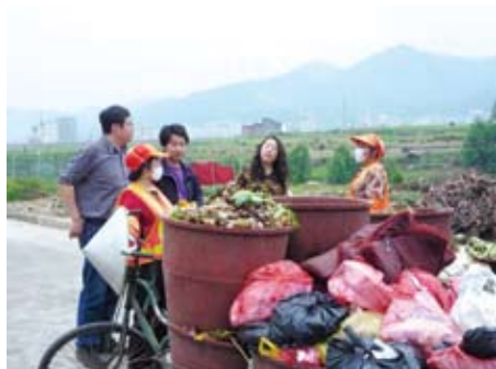
赴广西调研垃圾分类和厨余处理