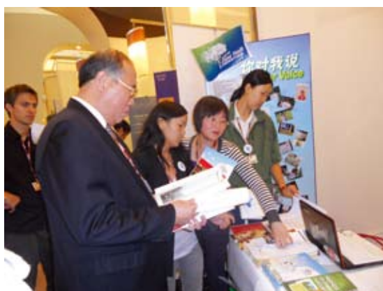
天津气候变化谈判期间，解振华在中国NGO展台前停留

在天津气候变化谈判和坎昆气候变化谈判期间，参加了和国家发改委副主任解振华的交流。并将《绿色中国，竞跑未来——中国公民社会致联合国气候变化谈判坎昆会议的立场书》递交给国家发改委副主任解振华。