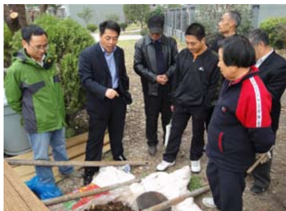
上海小组社区垃圾减量活动