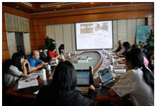
参加联合国气候变化谈判天津会议