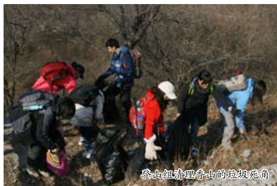
登山组清理香山的垃圾死角

举办20多期自然讲堂，除配合主题小组举办主题讲座外，还举办了20几期其它议题的公众讲座。