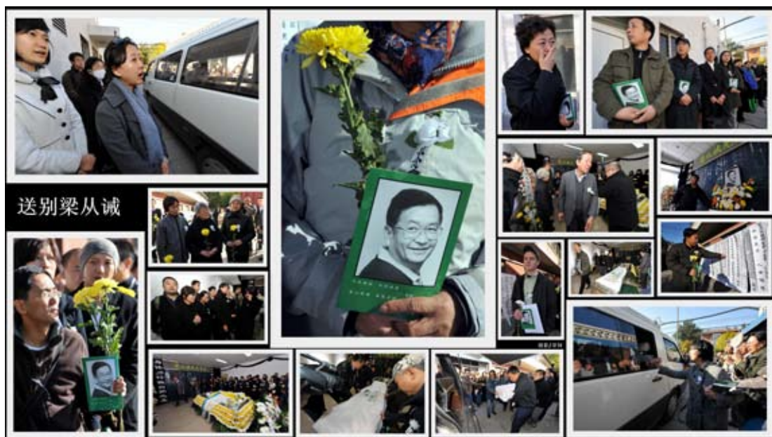
社会各界送别梁先生。